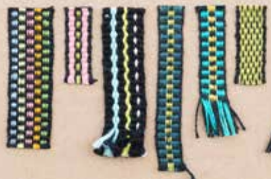
Grafisk tilrettelæggelse: Gina Hedegaard Nielsen

Laugets Vævekurser samarbejder med Dansk Tekstillaug - væv, tryk og broderi og er medlem af Fora.