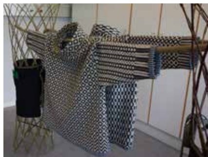
Et projekt fra modul IV i Skals 2022. Vævet sweater og forklæde til brug i gartneriet af Kirsten Bengtson.